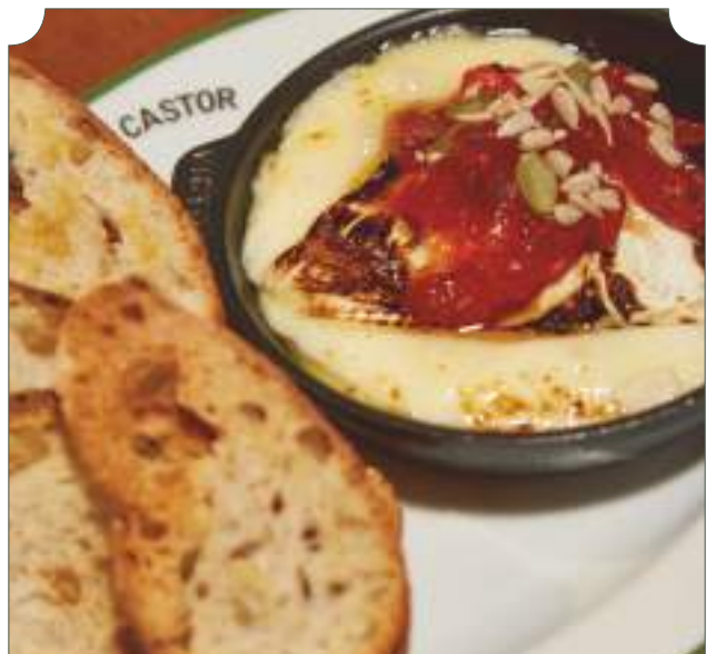
Brie al horno