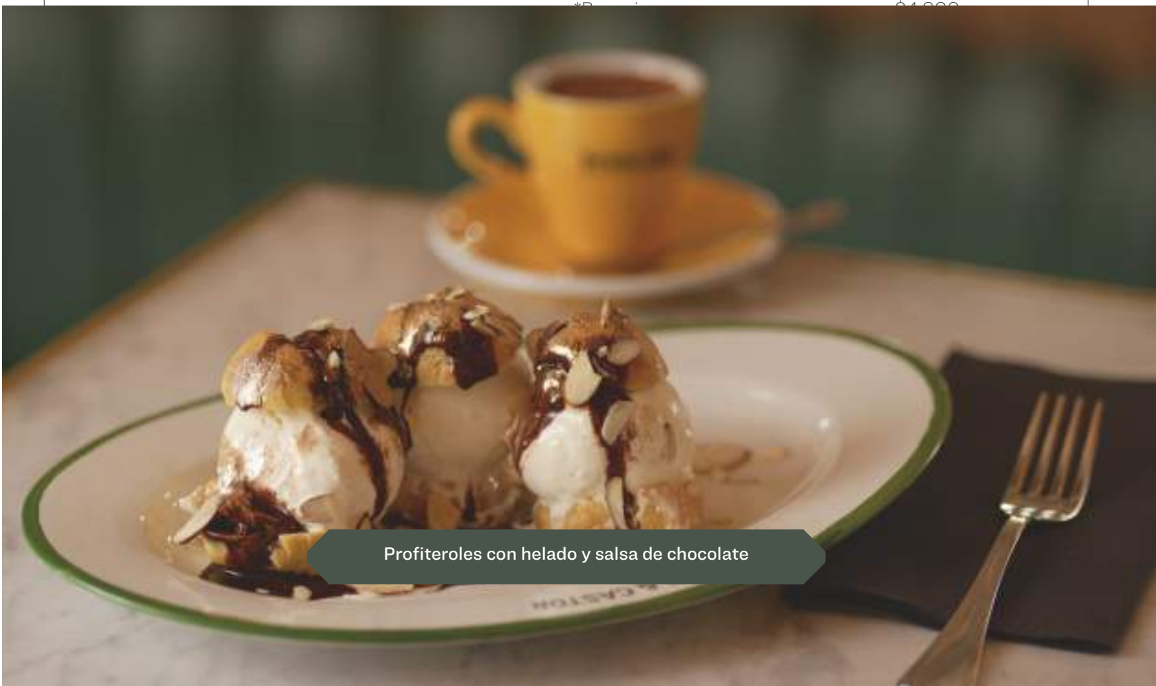
Profiteroles con helado y salsa de chocolate