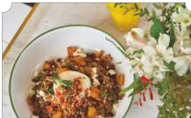
Calentado de frijol negro