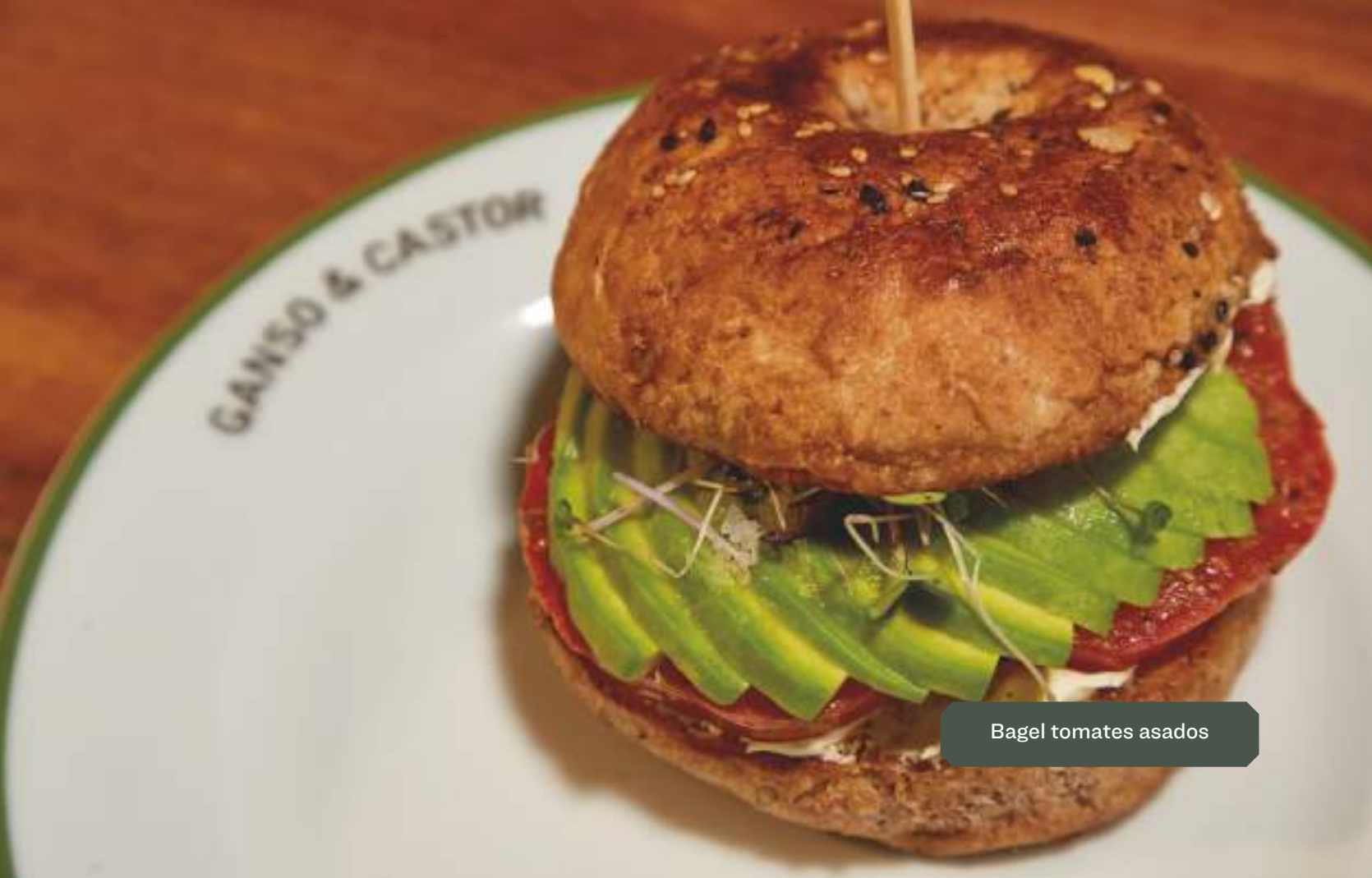
Bagel tomates asados