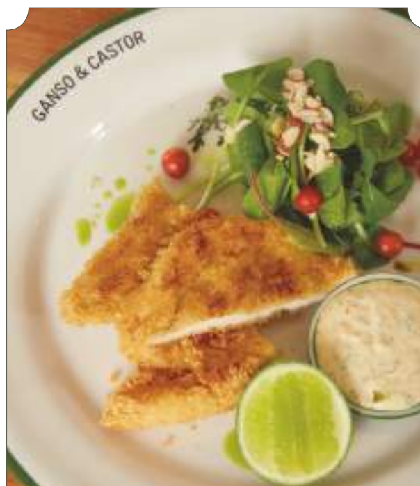
Milanesa de pollo