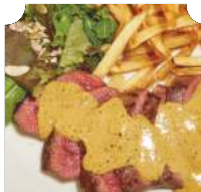
Café de parís