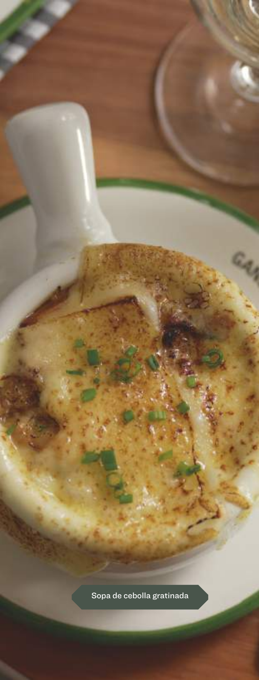
Sopa de cebolla gratinada